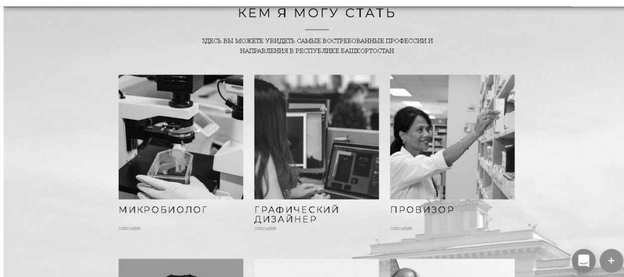
Рис. 4. Раздел «Кем я смогу стать»

На данный момент в Республике Башкортостан наблюдается заметная миграционная убыль молодёжи, что является значимой проблемой для республики, которая влечет за собой такие последствия, как «старение» населения, отток умов и рабочей силы из республики и пр. [3]