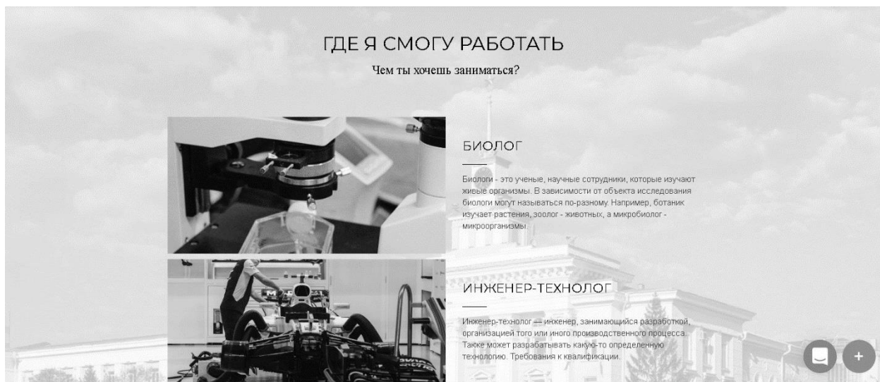
Рис. 3. Раздел «Где я смогу работать»

В разделе «Куда пойти учиться» пользователь сможет получить всю необходимую информацию об учебных заведениях высшего и среднего специального образования Республики Башкортостан, ознакомиться с условиями поступления, наличием бюджетных мест и непосредственно стоимостью обучения без перехода на официальные сайты учебных заведений.