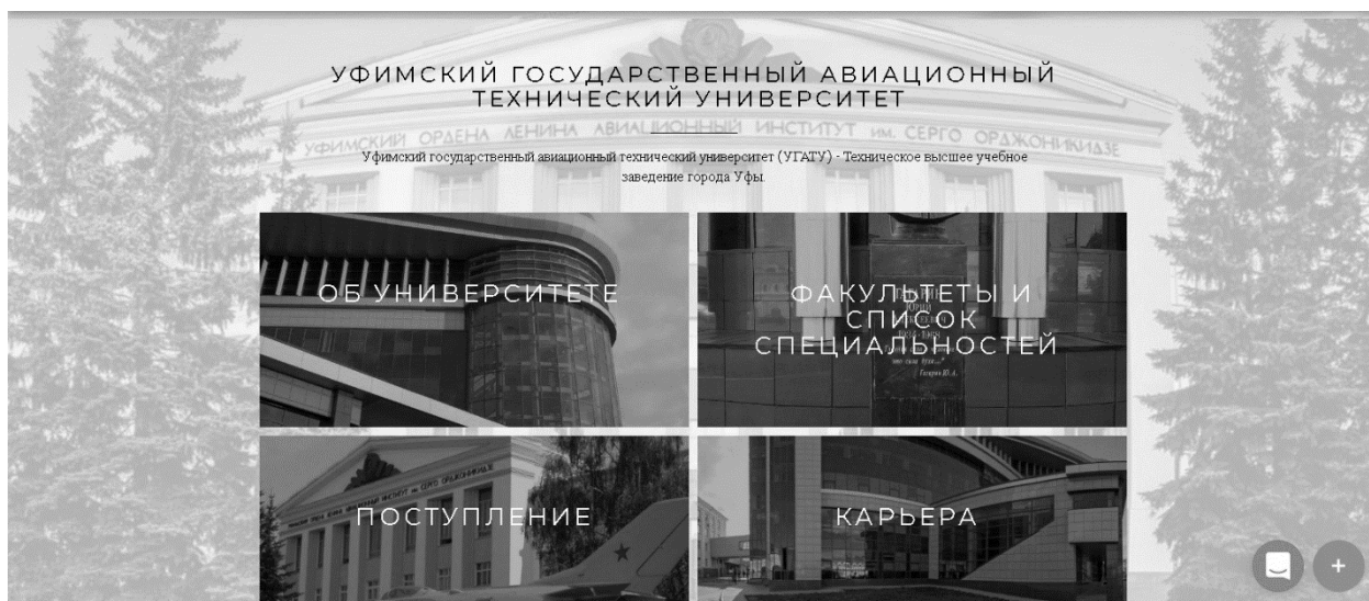
Рис. 2. Разделы при выборе определенного университета

В разделе «Куда пойти учиться» представлены все учебные заведения высшего и среднего специального образования Республики Башкортостан. При выборе каждого из них предоставляется информация по специальностям, направлениям подготовки, в том числе наличие востребованных на данный момент направлений, которым можно обучиться в заведении.