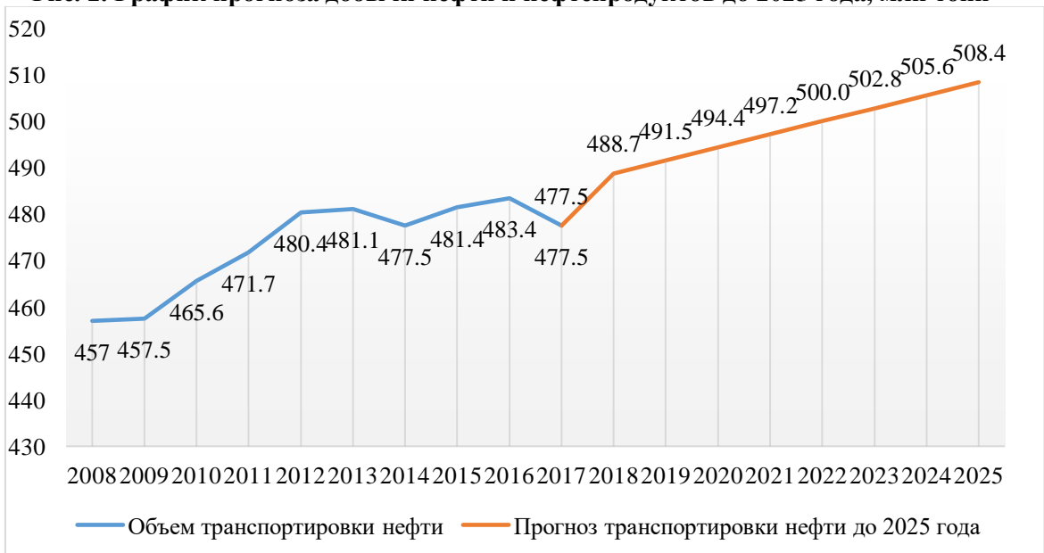
Рис. 3. График прогноза транспортировки нефти и нефтепродуктов до 2025 года, млн тонн